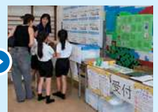
フードパントリーの様子