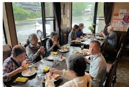
喫茶店でお茶する様子