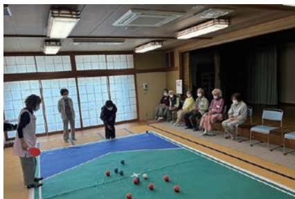
レクリエーションの様子

恵那市社協では、恵那・岩村・明智・串原・上矢作でいきいき教室事業を行っています。各事業所では体験利用や見学を随時承っております。