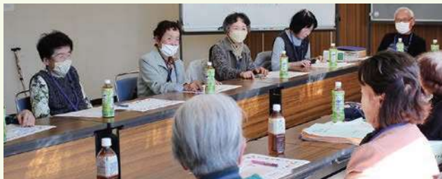
投稿者の集いの様子

「まめなかな」は、共同募金の配分を受け恵那市社協が発行するひとり暮らし高齢者対象の情報誌です。民生委員さん等が月2回ご自宅にお届けすることにより、見守り活動にもつながっています。また、「まめなかな」は読者から寄せられた手紙や俳句、絵手紙などの投稿が主となっております。年に1回交流の機会として「投稿者のつどい」を開催し、読者同士の交流も行っております。