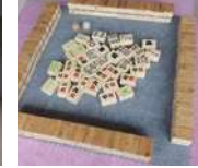
コミュニケーション 麻雀セット