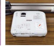
プロジェクター・スクリーン