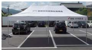
大型テント(折りたたみ式:1張)