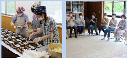
ふれあい食事サービス (串原:くしはら配食サービス) ふれあいいきいきサロン (上矢作:ふれあいサロン横道)