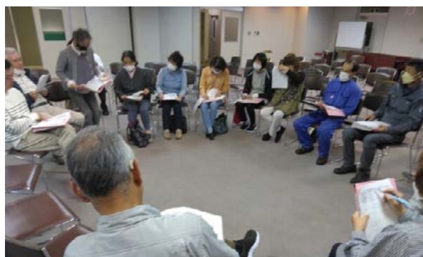
明智支部 見守り活動事業“明智町福祉委員連絡会”