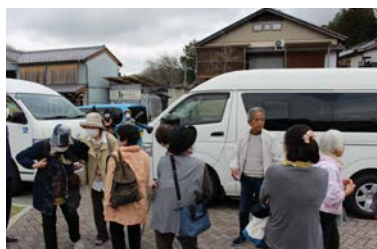
サロンでお出かける様子 (大井:学頭なごみ会)

高齢者や障がい者の方を対象にしたサロン、子育て中の親子を対象にしたサロンなど合計117グループが市内で活動しています。