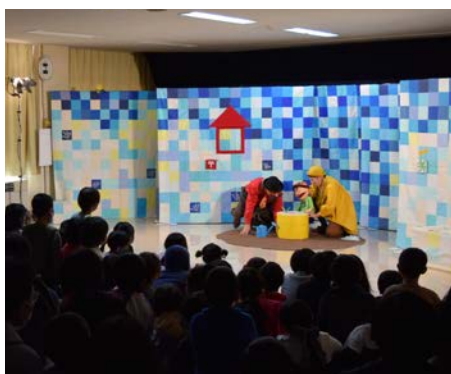
大井支部 子育て支援事業“地域ふれあい交流会”

現在各地域の自治会長様等を通じてお願いしております。地域から集まった社協一般会費は社協13支部の活動へと100%還元されます。