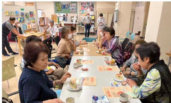
東野支部 ひとり暮らし高齢者交流事業“まめやかな交流会”