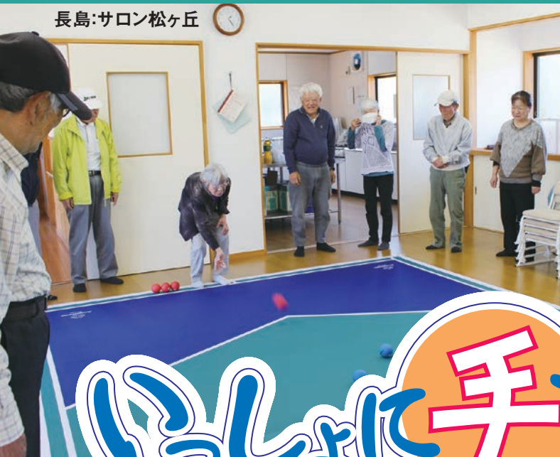
長島:サロン松ヶ丘