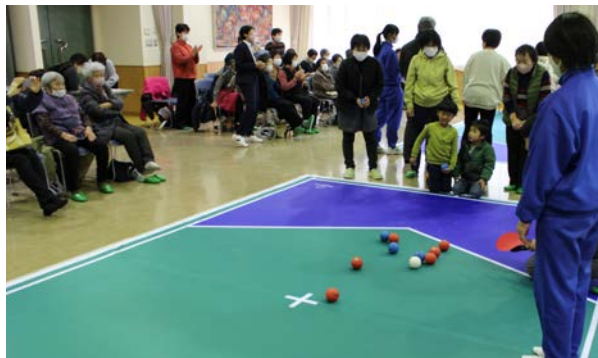
中野方支部 多世代交流事業“福祉の日”