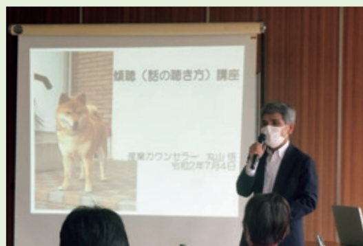
過去の講座の様子

申し込み・問い合わせ 恵那市社協ボランティアセンター TEL 0573-26-5221 (代)